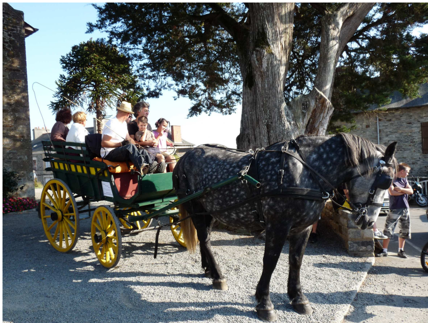
Transport de personnes en situation semi-urbaine et rurale. Navette lors de manifestations publiques, festivals... Visites du patrimoine bâti et naturel.