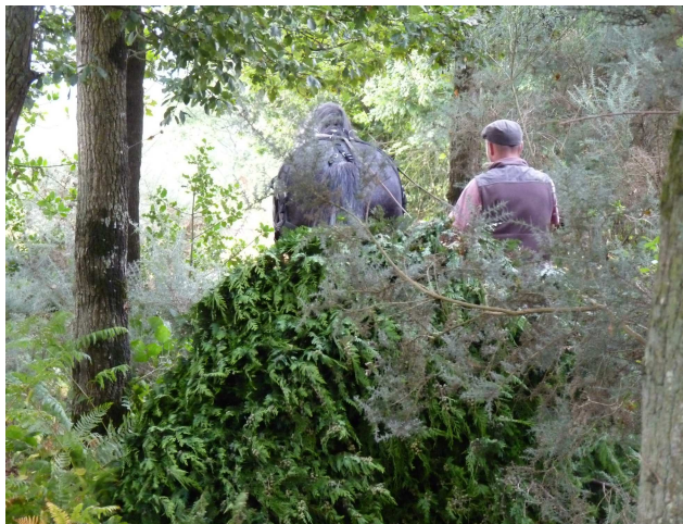
Débusquage de bois

TRAITS-MOBILES met en place des usages contemporains de traction animale. Nous possédons des outils modernes et anciens adaptés aux besoins de nos clients. Nous travaillons également à l'élaboration de prototypes pour continuer à apporter des solutions modernes et écologiques à la gestion environnementale du territoire.