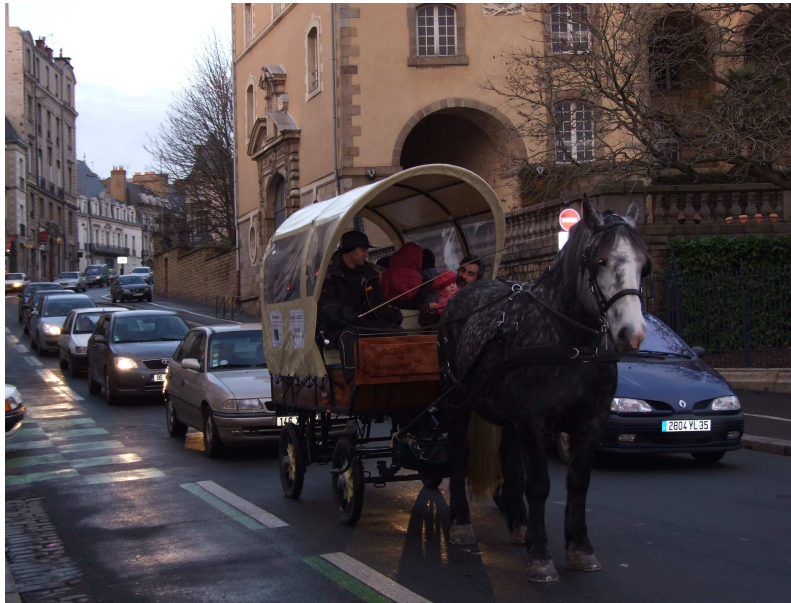
Transport de personnes en situation urbaine, ci-dessus centre ville de Rennes (35).