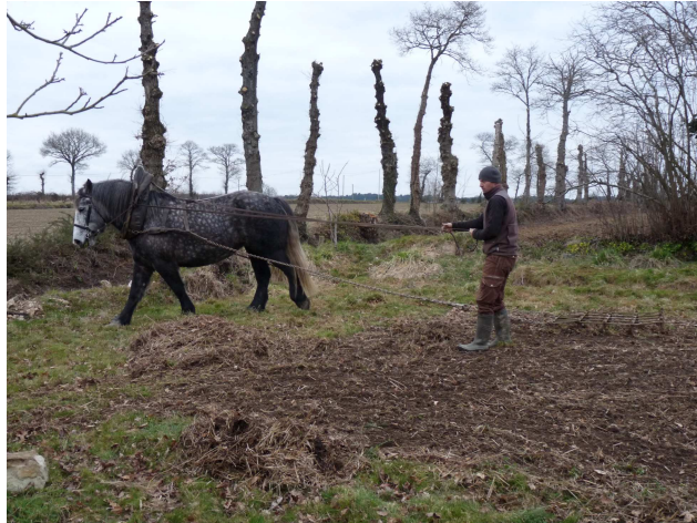
Hersage et entretien de chemin