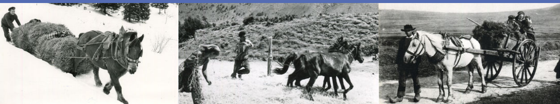
Credits Images : Photo de Gérard Collomb (1) - Musée du Quai Branly (2) - Carte postale en accès libre (3) - Impression service reprographie UA

Porté par le groupe du même nom, ce colloque est organisé, dans le cadre d'un partenariat entre l' ESTHUA, Institut national du tourisme - INNTO France de l' Université d'Angers , et le ministère de la culture , tous les deux ans dans une ville du cheval , autour de thématiques variées, avec le soutien de IIFCE et de la FFE . Son dessein est de permettre aux différentes cultures équines de se connaître davantage, lors d'une journée d'échanges et de partages . L'édition 2026 est consacrée au thème Races équines, histoires et territoires . Nous ferons jouer ces notions à partir de cas particuliers et sous des angles divers. Nous traiterons des races de chevaux dans leurs berceaux historiques. Les territoires seront ensuite considérés sous l'angle de la contribution des races, patrimonialisées, à la vie économique, sociale et culturelle. Seront enfin discutées les questions du travail avec les équidés, dans les représentations et les pratiques, hier et aujourd'hui. Notre objectif est de rassembler universitaires, institutionnels, professionnels de la filière, mais aussi passionnés des chevaux et du monde équin. Le colloque se terminera par des démonstrations d'attelage et une visite du Haras du Pin.